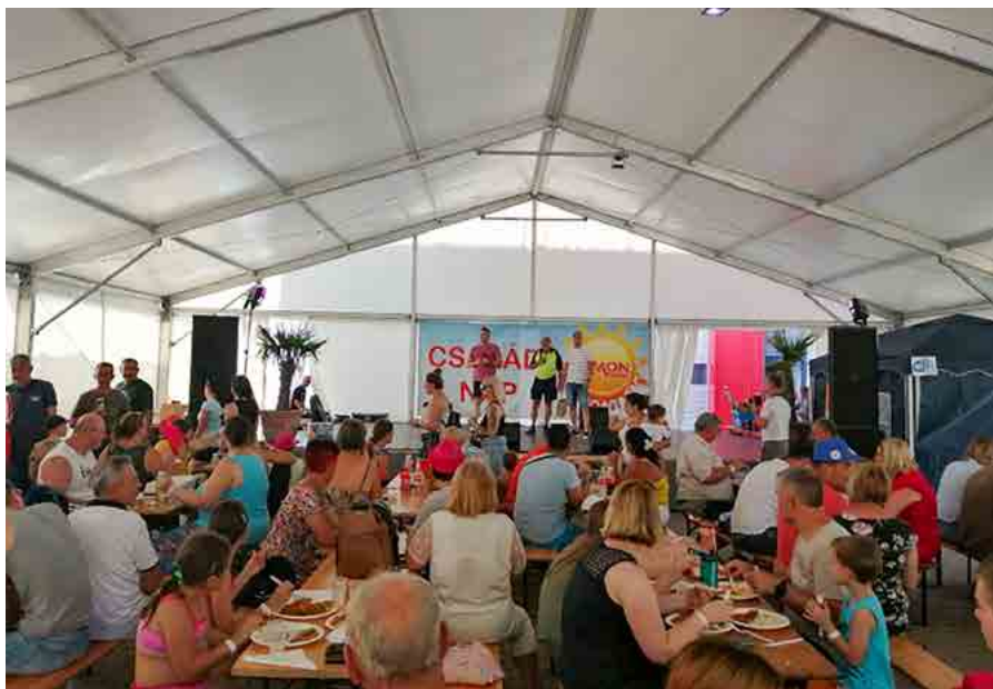
Családi nap a Simon Plastics-nál

A Simon Plastics Kft. sikeresen ötvözi a családbarát törekvéseket a vállalati hatékonysággal. A vállalatvezetés számára kiemelten fontos, hogy a munka és a magánélet egyensúlya oly módon legyen biztosított, hogy eközben a munkavállalók családi életét támogató intézkedések hosszú távon fenntarthatók maradjanak. Az elérhető rugalmas munkavégzés, részmunkaidős lehetőségek, valamint az egyedi munkaidő beosztása mind hatékony eszköznek bizonyult annak elérésében, hogy a Simon Plastics olyan munkahellyé válhasson, ahol a dolgozók valódi összhangot teremthetnek szakmai és személyes életük között.