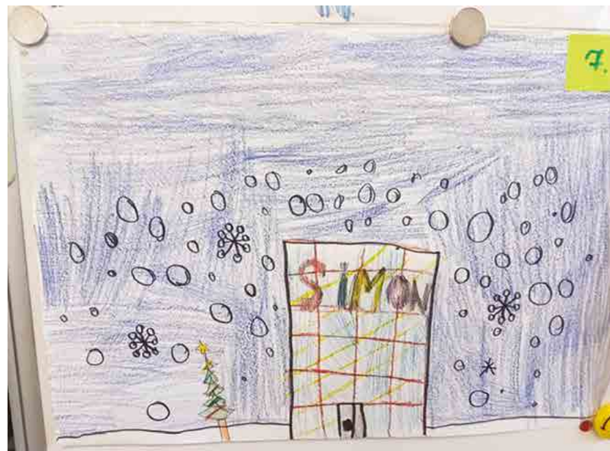
A gyermekrajzverseny egyik alkotása

A Simon Plastics Kft. 2017-ben elnyerte a Családbarát, Felelős Foglalkoztató díjat, amelyet a Székesfehérvári Család és KarrierPont adományozott a vállalatnak. Az elismerés a cég hosszú távú, elkötelezett munkáját díjazza, melyben célul tűzték ki a munka és a magánélet harmóniájának biztosítását a munkavállalók számára. A Simon Plastics az évek során sikeresen egyesítette a családbarát szemléletet a termelés hatékonyságával, így a vállalat nemcsak a helyi gazdaságban kiemelkedő, hanem a munkaerőpiacon is példaértékű.