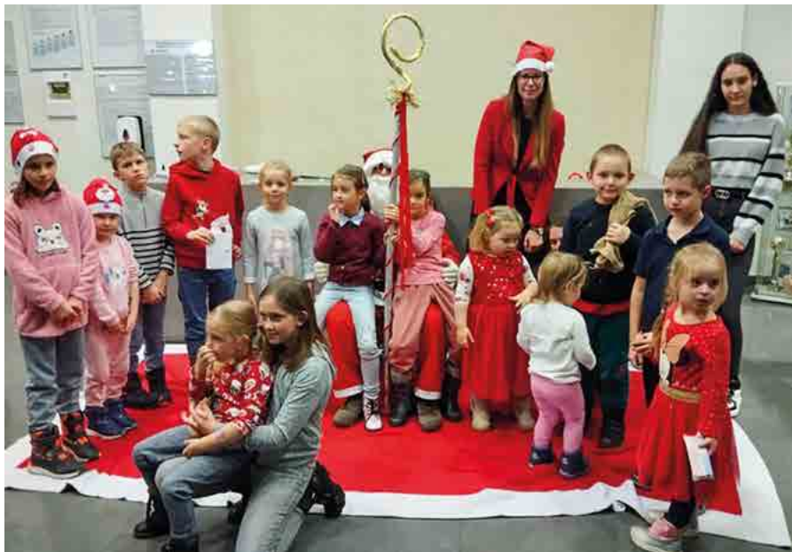
Mikulásünnepség a vállalatnál

A Simon Plastics Kft. nemcsak a hagyományos munkarend mellett különböző, rugalmas foglalkoztatási formákkal biztosítja, hogy munkavállalói harmonikusan ötvözhessék munkahelyi és családi szerepeiket. A cég külön figyelmet fordít a GYES-ről visszatérő édesanyákra is, akik számára egyműszakos munkarendet alakítottak ki, lehetőséget nyújtva arra, hogy családi feladataik mellett továbbra is munkát vállalhassanak. A vállalat a megváltozott munkaképességű munkavállalókat is aktívan foglalkoztatja, mind az ügyintézés, a raktárkezelés, mind pedig a termelési folyamatok során, hozzájárulva a társadalmi esélyegyenlőség eléréséhez.