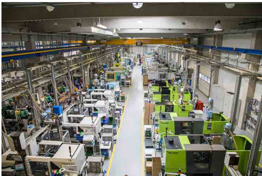
A Simon Plastics üzemének egy része és a modern, robotos fröccsöntőgépek

Az elmúlt évtizedekben a folyamatos fejlődése után a Simon Plastics mára a magyar műanyagipar egyik meghatározó szereplőjévé vált. Az autóipar számára gyártott kábelkorbács csatlakozók, audio technikai alkatrészek és esztétikai termékek mind a cég magas színvonalú és innovációs képességét tükrözik, ezt a sikert azonban nemcsak a technológiai fejlődésnek köszönhetik, hanem annak a tudatos vállalati kultúrának is, amely minden tevékenységük alapja.